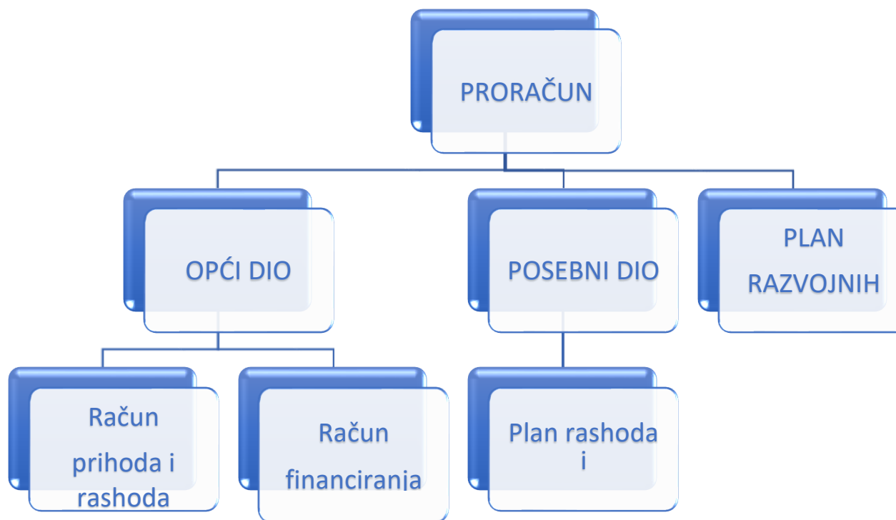
Slika 1. Struktura proračuna